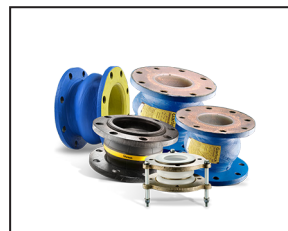
Jointts de dilatation