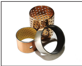
Coussinets / douilles