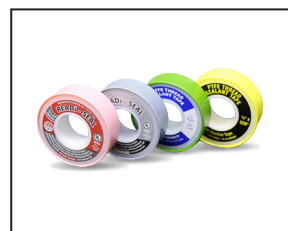
Rubans d'étanchéité en PTFE