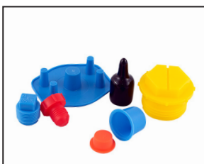
Capuchons / bouchons