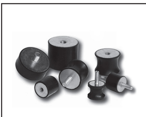
Amortisseur de vibration