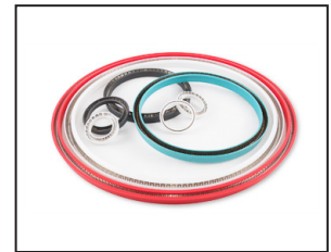
Jointts en polymère à ressort