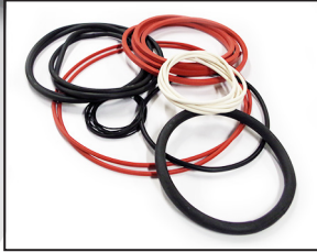
Cordon pour courroie d'entraînement