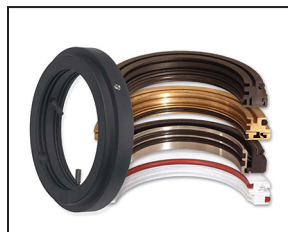
Isolateurs de roulement