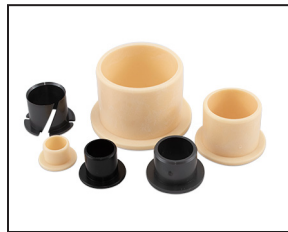
Coussinets en polymère