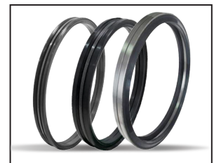
Jointts mécaniques flottants